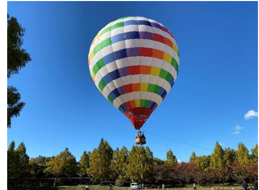
熱気球係留フライト体験