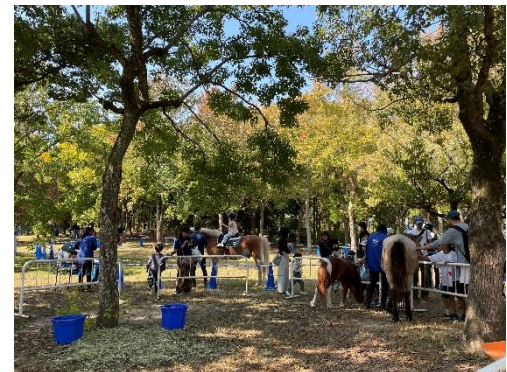
ポニーのふれあい