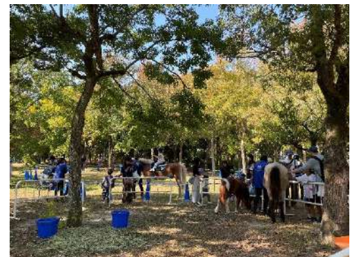
ポニーのふれあい