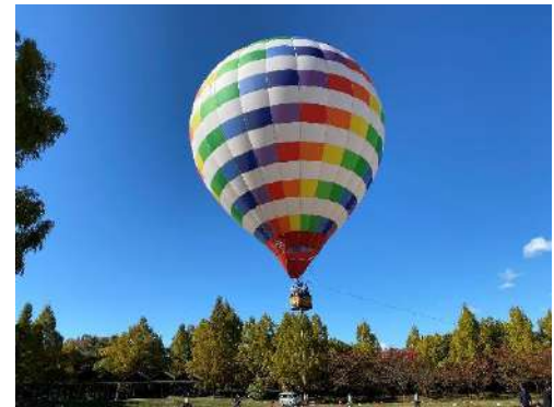
熱気球係留フライト体験